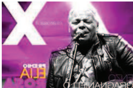
X EDIZIONE 2016 ENZO GRAGNANIELLO