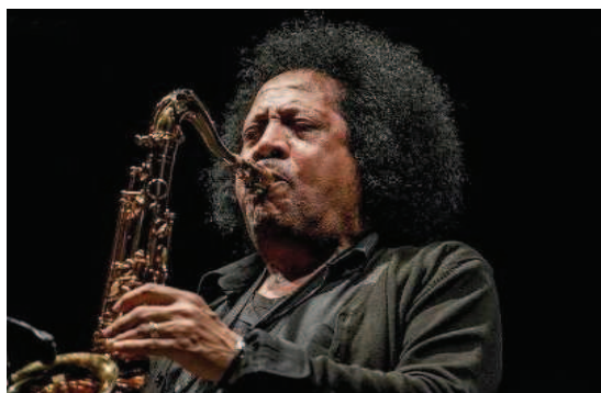
XI EDIZIONE 2017 JAMES SENESE