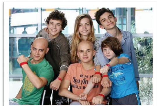
Pio Piscelli Toni di "Braccialetti Rossi"