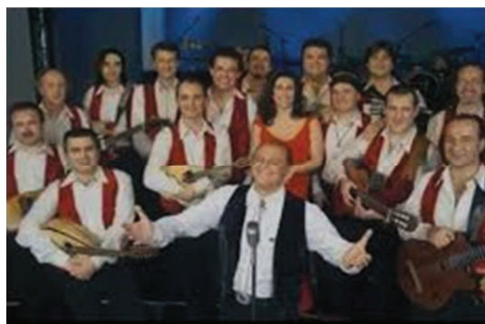
XII EDIZIONE 2018 ORCHESTRA ITALIANA