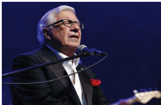
IX EDIZIONE 2015 PEPPINO DI CAPRI